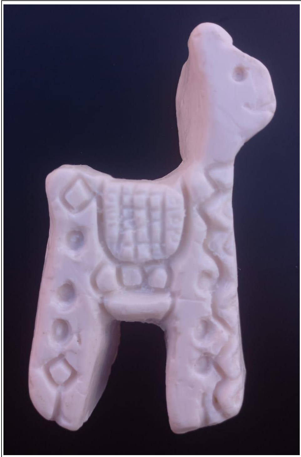
Tabla 11: evidencia fotográfica de la muestra 04 del cuarto estudiante.