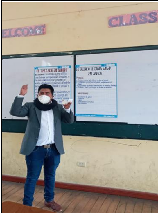
Figura A3 Explicando con ejemplos y papelotes sobre el tallado de t'anta wawas en jabón.