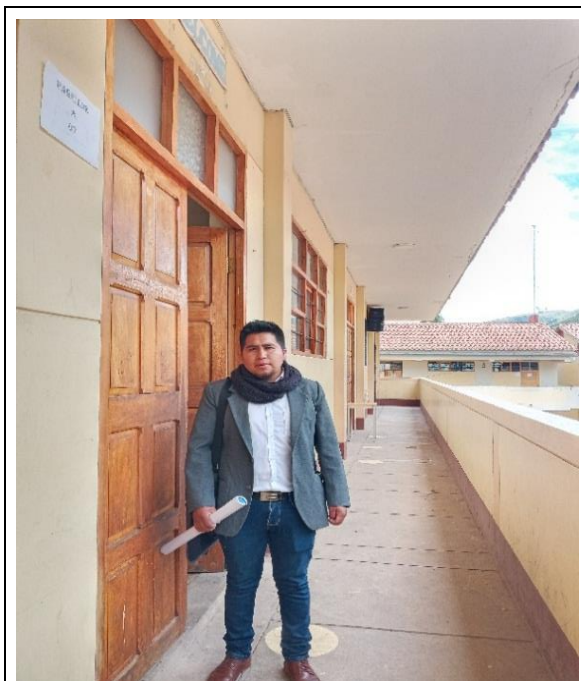
Figura A1 Ingresando al aula para desarrollar la primera sesión de aprendizaje.