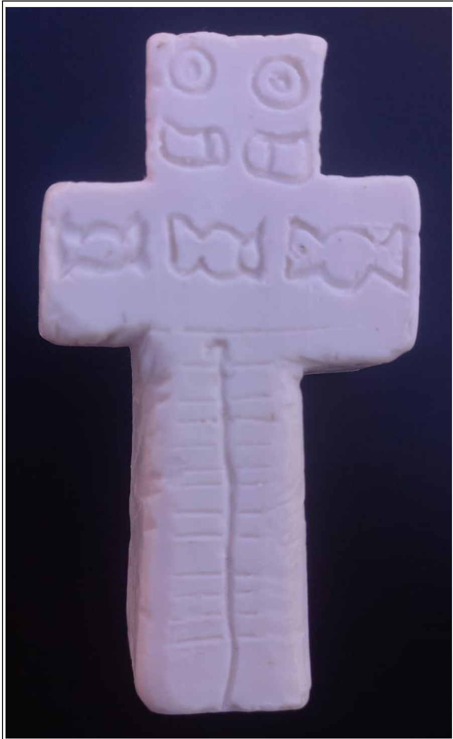
Tabla 23: Evidencia fotográfica de la muestra 08 del octavo estudiante.