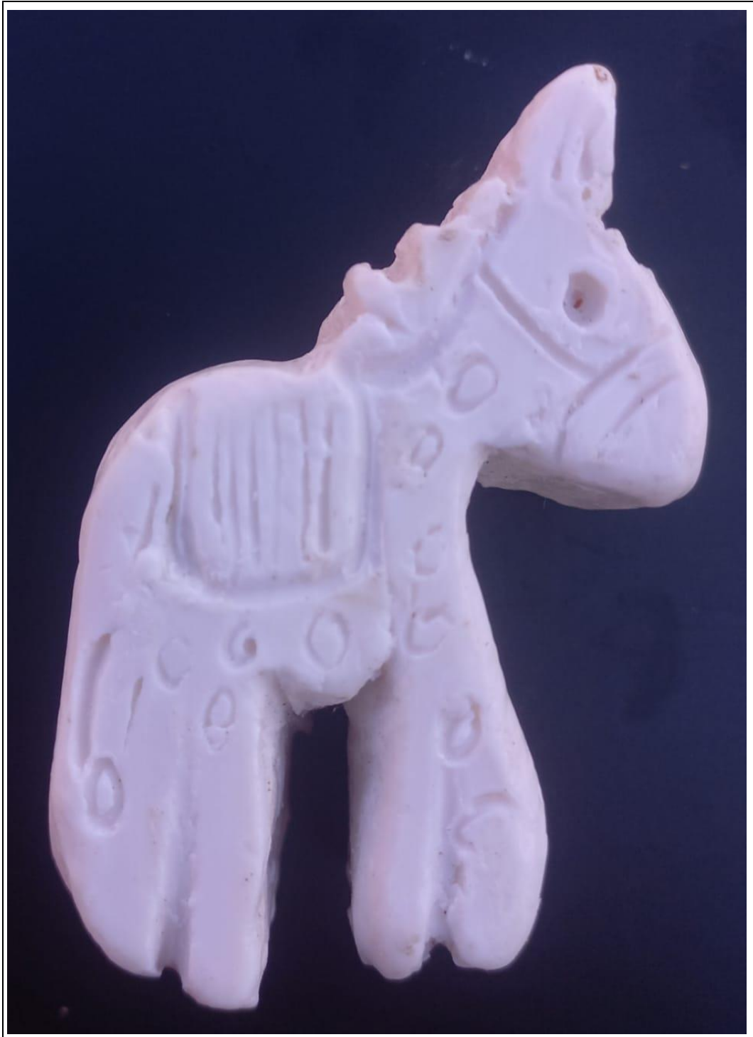
Tabla 14: evidencia fotográfica de la muestra 05 del quinto estudiante.