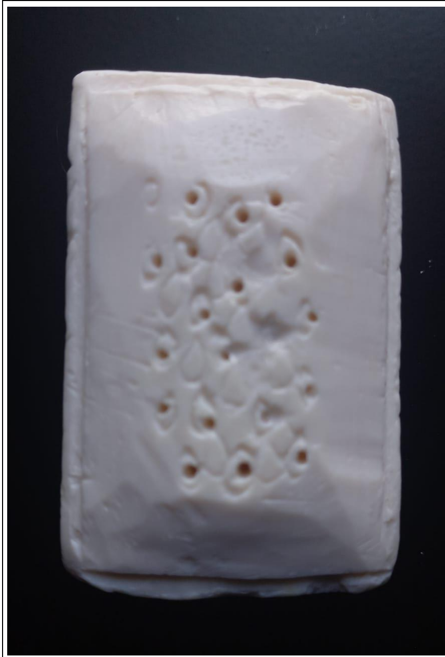
Tabla 26: evidencia fotográfica de la muestra 09 del noveno estudiante