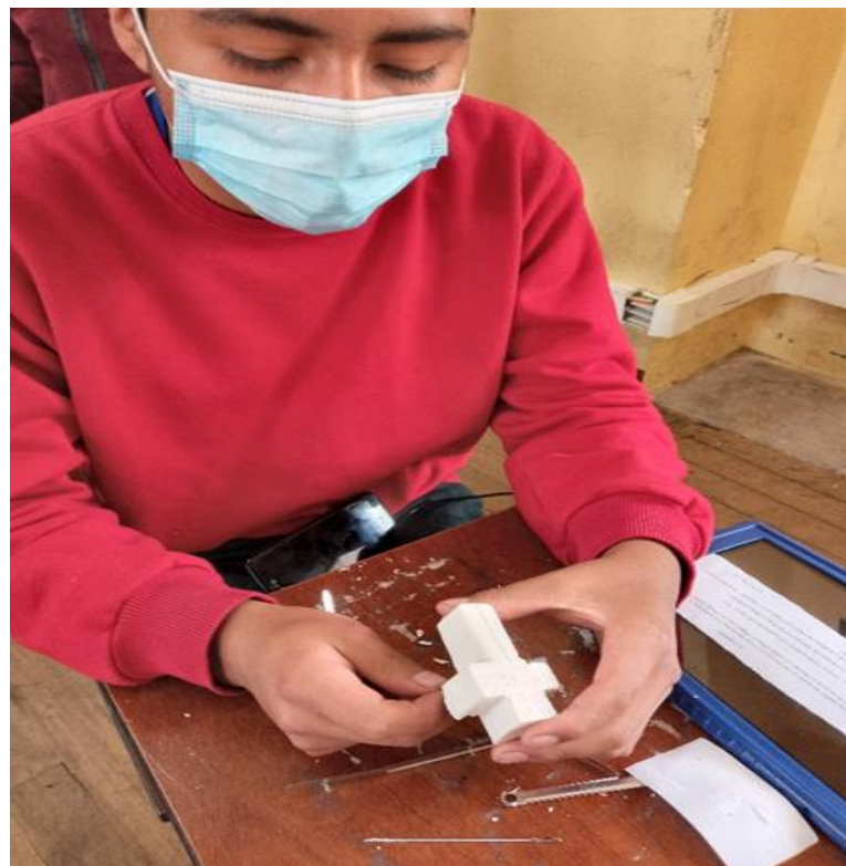
Figura A9 Profundizando los detalles del tallado.