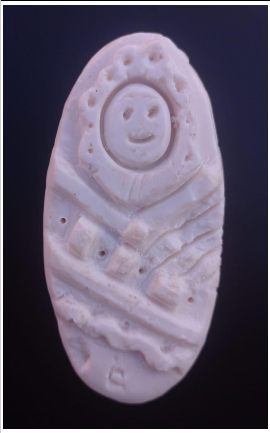
Tabla 5: evidencia fotográfica de la muestra 02 del primer estudiante.