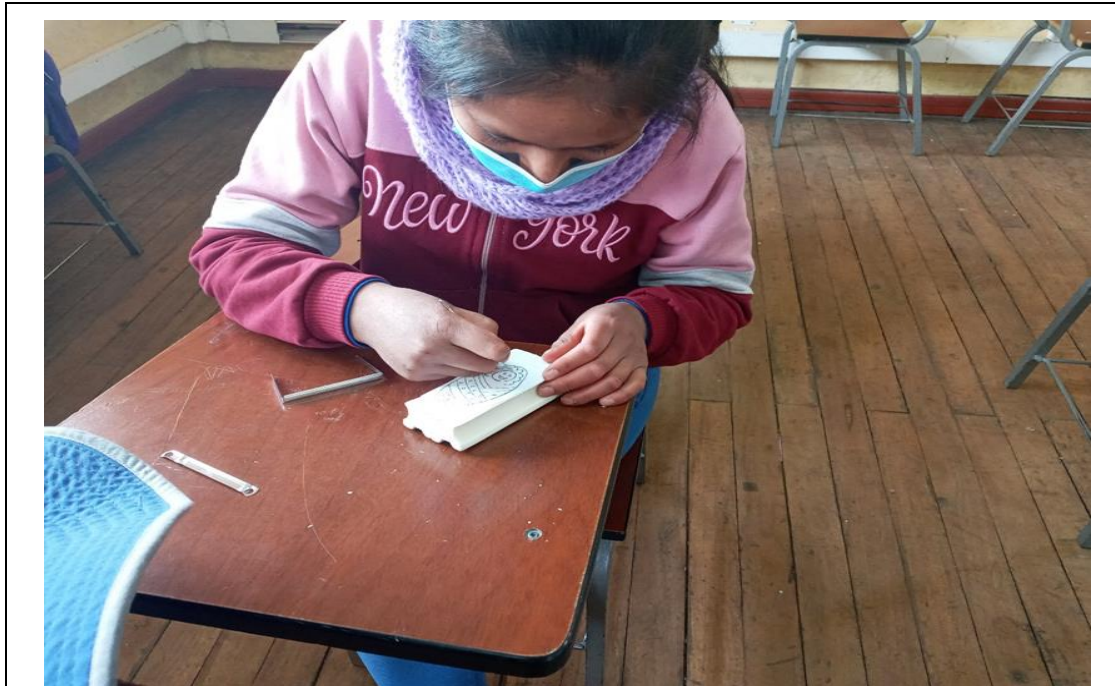
Figura A5 Iniciando con el calcando de la imagen para proceder con el tallado.