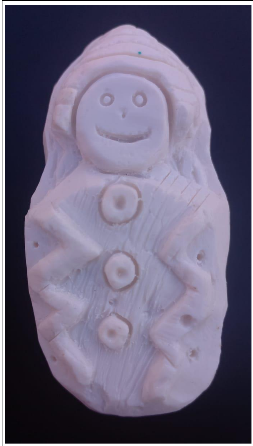
Tabla 8: evidencia fotográfica de la muestra 03 del primer estudiante.