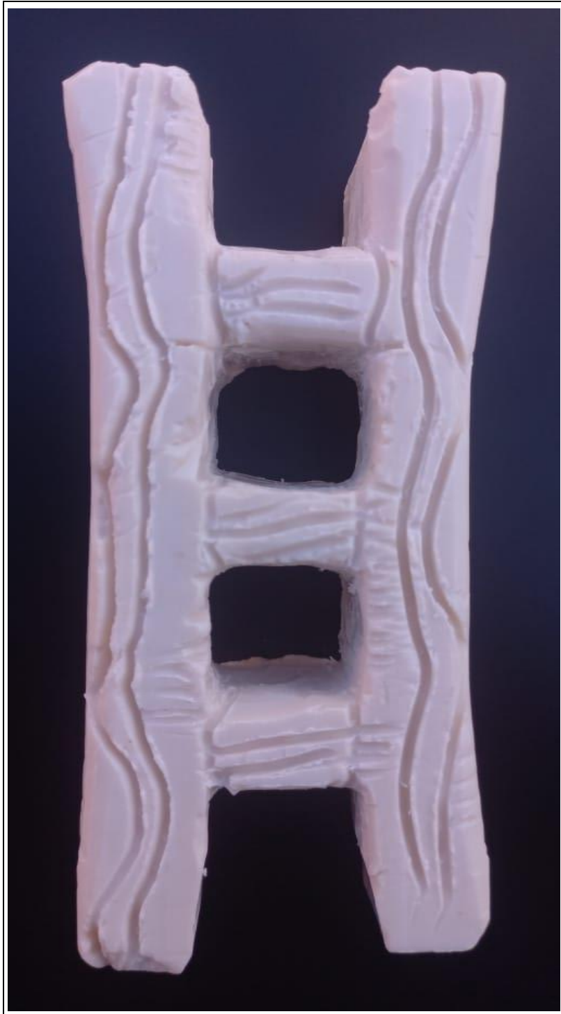
Tabla 20: evidencia fotográfica de la muestra 07 del séptimo estudiante.