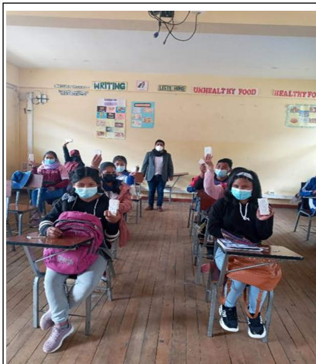
Figura A4 Haciendo la entrega correspondiente de los materiales.