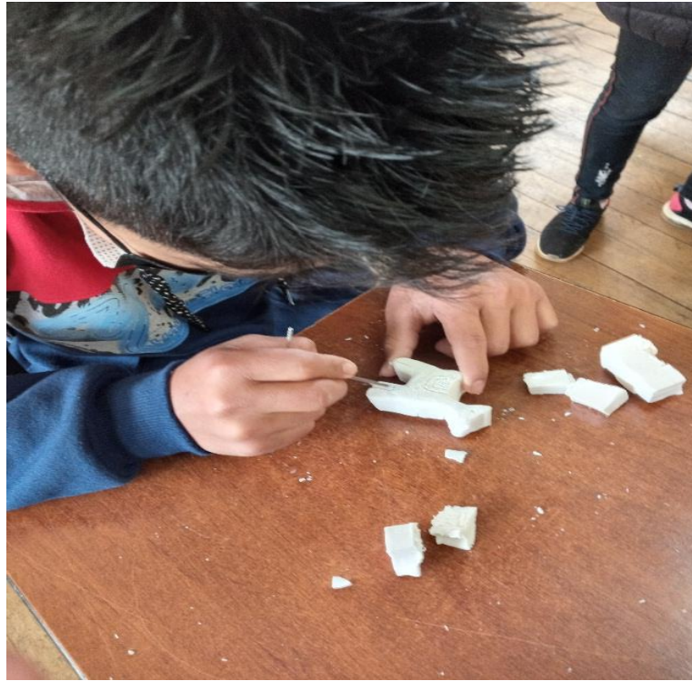
Figura A7 Definiendo la silueta del trabajo.