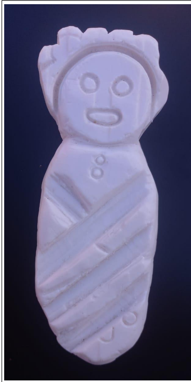
Tabla 29: evidencia fotográfica de la muestra 10 del décimo estudiante