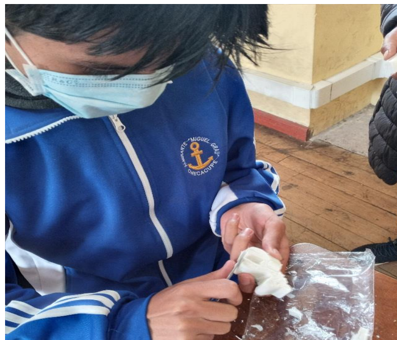
Figura A8 Dándole forma a su vez encontrándonos con nuestro objetivo.