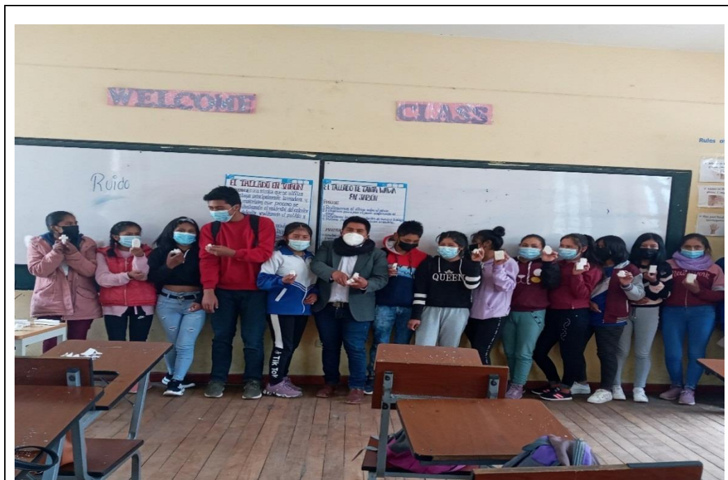
Figura A11 Exponiendo los trabajos de tallados de t'anta wawas en jabón.