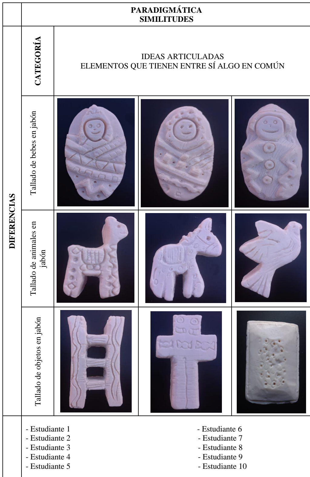
Tabla 32: Análisis gráfico en base a clasificación por categorías