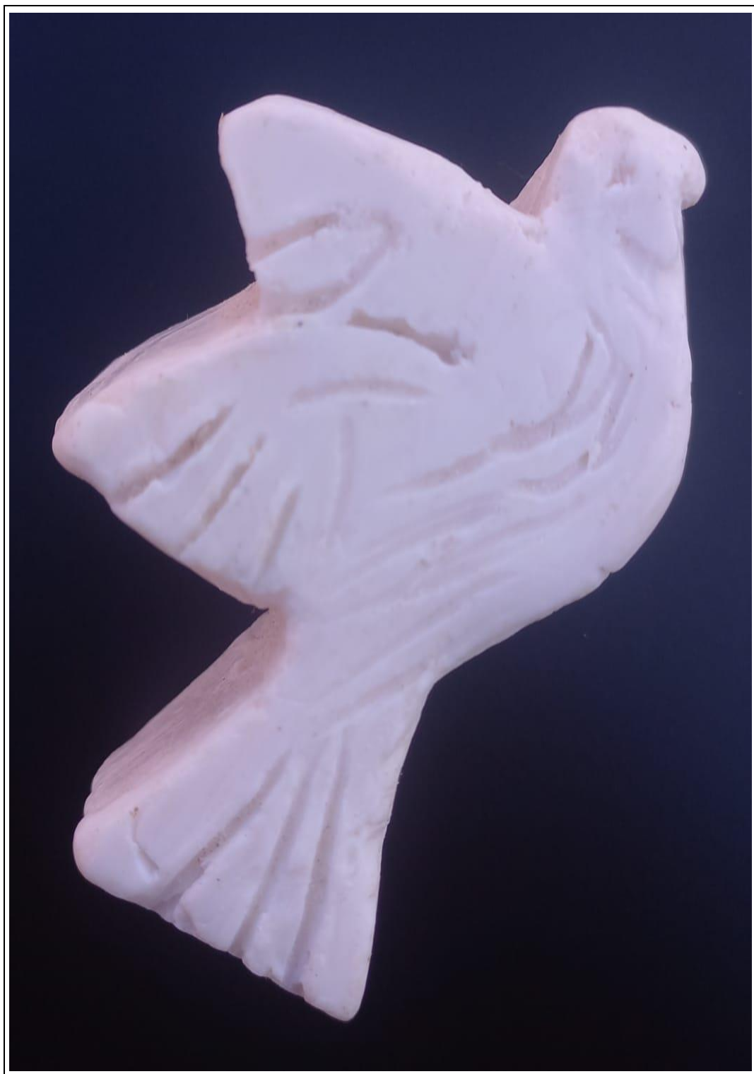
Tabla 17: evidencia fotográfica de la muestra 06 del sexto estudiante.