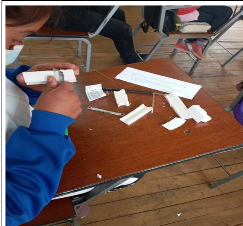
Figura A6 Quitando el jabón que no nos sirve en bloques, siempre respetando el diseño.