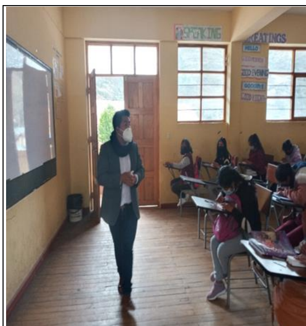
Figura A2 Desarrollando la primera sesión