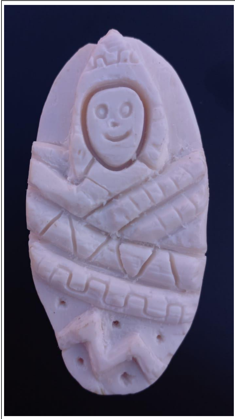
Tabla 2: evidencia fotográfica de la muestra 01 del primer estudiante.