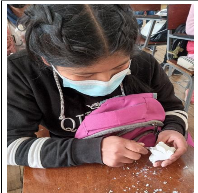
Figura A10 Puliendo y dándole el toque final al tallado.