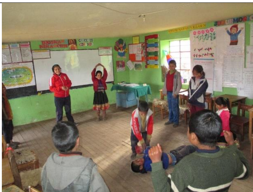
Figura 5: Desarrollando dinámicas de improvisación teatral.

“Interpretar los valores estéticos de la escenificación teatral de marionetas para desarrollar la capacidad de expresión oral de los estudiantes del sexto grado del nivel primario de la Institución Educativa N°50834 del Anexo de Huathua Laguna”.