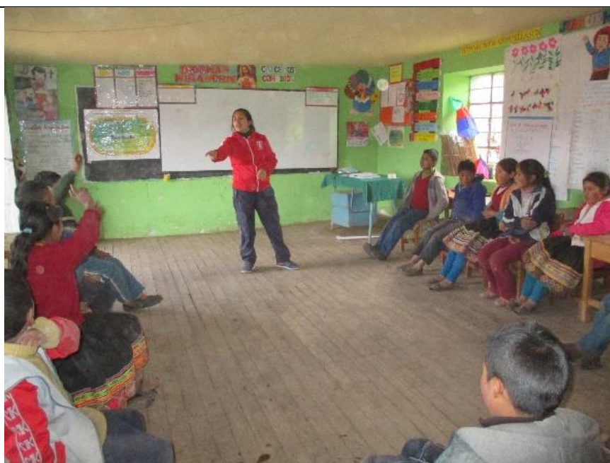
Figura 7: Creando cuentos encadenados.

“Interpretar los valores estéticos de la escenificación teatral de marionetas para desarrollar la capacidad de expresión oral de los estudiantes del sexto grado del nivel primario de la Institución Educativa N°50834 del Anexo de Huathua Laguna”.