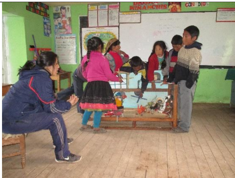
Figura 8: Ensayo de guion teatral con apoyo de la docente a través de la improvisación espontánea.

Interpretar los valores estéticos de la escenificación teatral de marionetas para desarrollar la capacidad de expresión oral de los estudiantes del sexto grado del nivel primario de la Institución Educativa N°50834 del Anexo de Huathua Laguna.