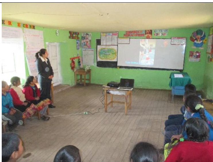
Figura 3: Observando un video de una marioneta bailando como motivación

“Interpretar los valores estéticos de la escenificación teatral de marionetas para desarrollar la capacidad de expresión oral de los estudiantes del sexto grado del nivel primario de la Institución Educativa N°50834 del Anexo de Huathua Laguna”.