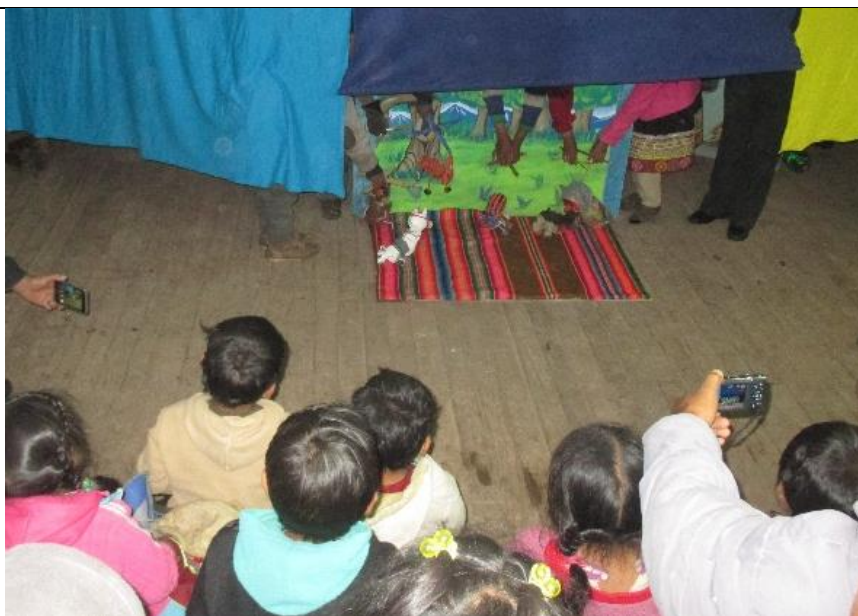
Figura 9: Presentación final del teatro de marionetas.

Interpretar los valores estéticos de la escenificación teatral de marionetas para desarrollar la capacidad de expresión oral de los estudiantes del sexto grado del nivel primario de la Institución Educativa N°50834 del Anexo de Huathua Laguna.