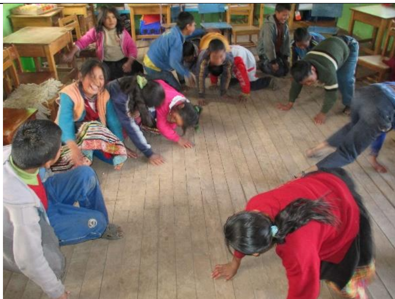
Figura 6: Desarrollando dinámicas de socialización

“Interpretar los valores estéticos de la escenificación teatral de marionetas para desarrollar la capacidad de expresión oral de los estudiantes del sexto grado del nivel primario de la Institución Educativa N°50834 del Anexo de Huathua Laguna”.