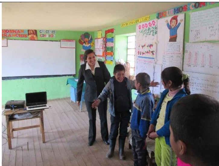
Figura 2: Desarrollando la dinámica de saludo sin hablar

“Interpretar los valores estéticos de la escenificación teatral de marionetas para desarrollar la capacidad de expresión oral de los estudiantes del sexto grado del nivel primario de la Institución Educativa N°50834 del Anexo de Huathua Laguna”.