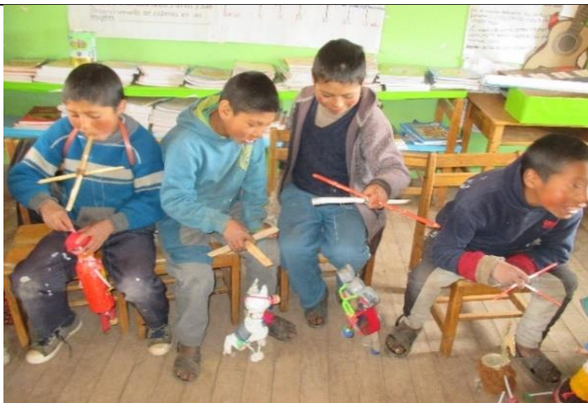
Figura 4: Explorando movimientos con sus marionetas.

“Interpretar los valores estéticos de la escenificación teatral de marionetas para desarrollar la capacidad de expresión oral de los estudiantes del sexto grado del nivel primario de la Institución Educativa N°50834 del Anexo de Huathua Laguna”.