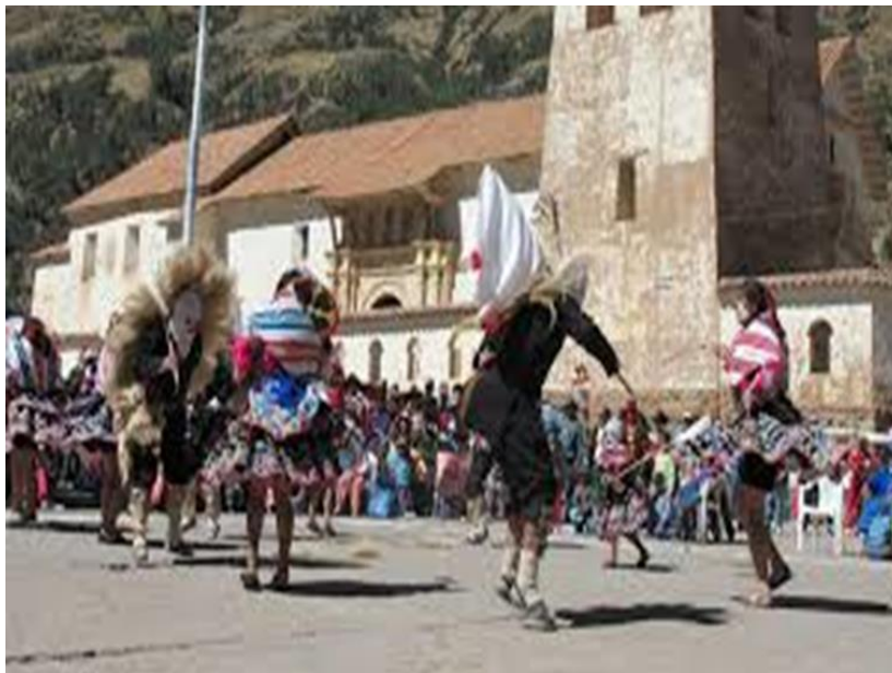
Danza Sarge ejecutada en el puente Colonial de Checacupe una sola pareja