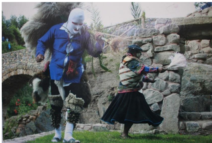
Foto de la danza Sarge. Alumno. C.P.L.A..