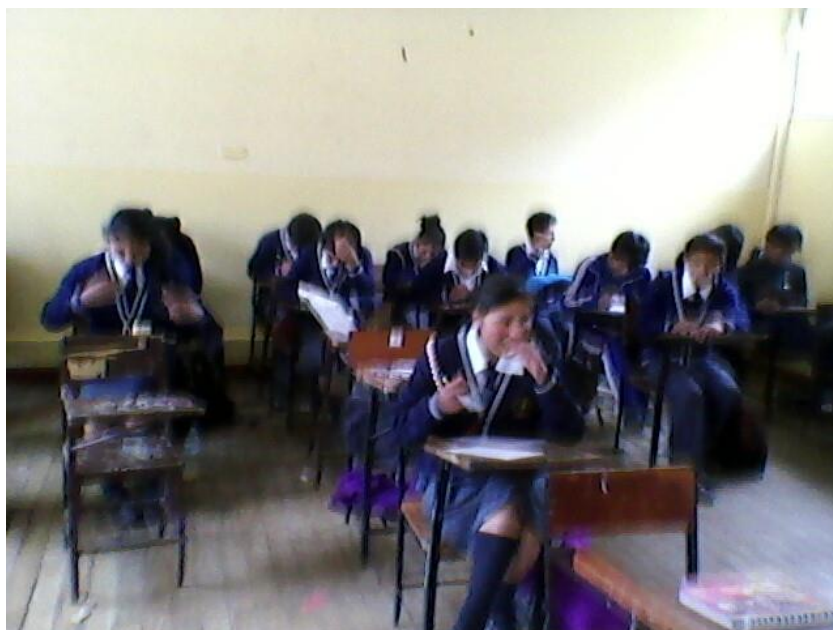
Foto N°. 04 Institución Educativa Almirante Miguel Grau de Checacupe